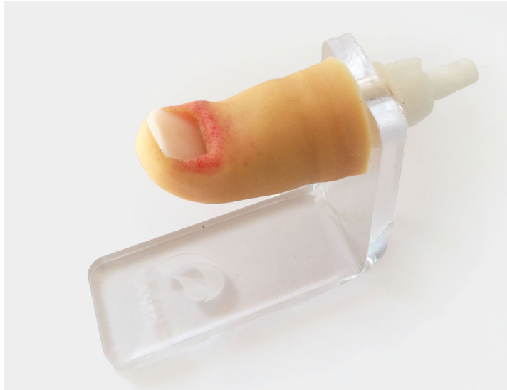
Simulador de oratejo montado en su soporte