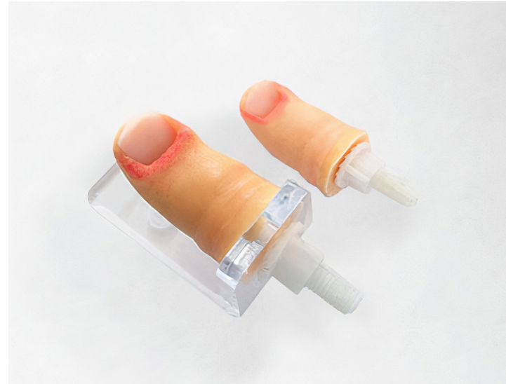
Simulador de oratejo y repuesto